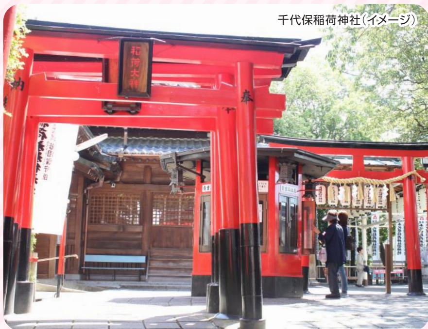
千代保稲荷神社(イメージ)