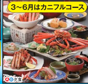
3~6月はカニフルコース